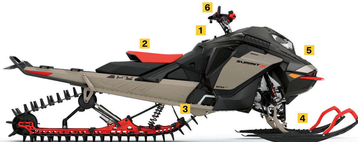
SUMMIT® X® AVEC ENSEMBLE EXPERT 154 850 E-TEC® TURBO MONTRÉ

Pour régler rapidement et sans outil la longueur de la sangle de la suspension arrière et obtenir l'élévation souhaitée de l'avant de la motoneige selon vos besoins du moment.