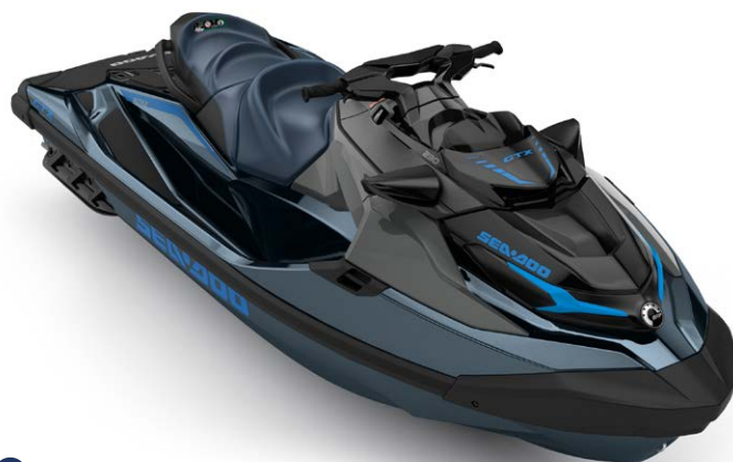
Blue Abyss / Gulfstream Blue