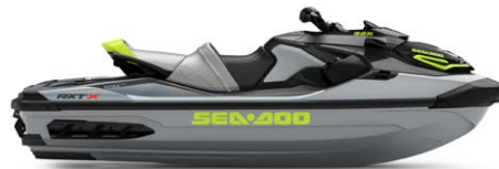
● Ice Metal і Manta Green