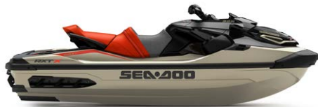
● НОВИЙ Metallic Tan і Lava Red Premium