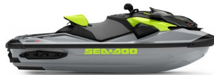
Ice Metal і Manta Green