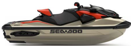
НОВИЙ Metallic Tan і Lava Red Premium